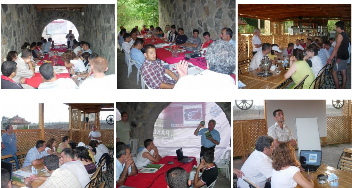
Foto. İşçi qruplarda sərbəst iş.