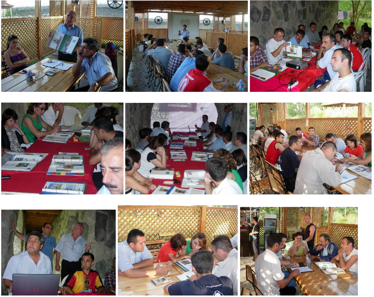
Foto. Təlimlər zamanı.