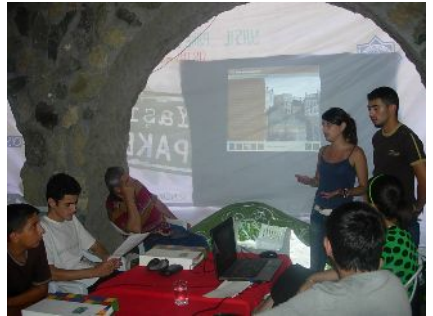
Foto. Təlimlər zamanı.