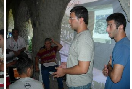
Foto. Təlimlər zamanı.