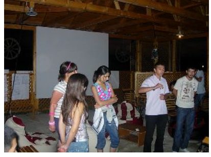
Foto. İşçi gruplarda iş.