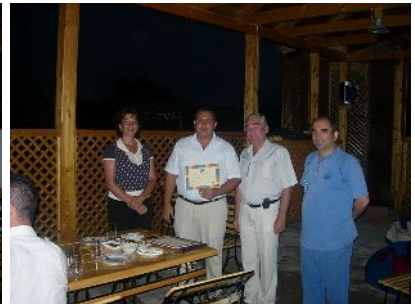
Foto. Sertifikatların tədqimatı.