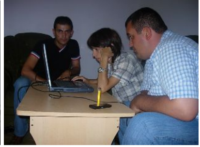
Foto. Kompüterdə sərbəst iş.