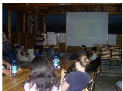
Foto. İşçi qruplarda iş.