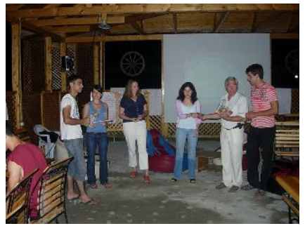
Foto. Sertifikatların tıdqm edilməsi.